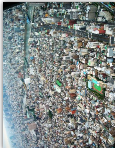
2012年9月 東京スカイツリー