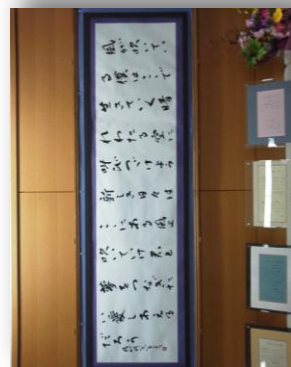
2012年10月 大船での書道展鑑賞