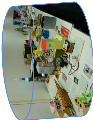
2012年9月 千葉市児童生徒科学作品展