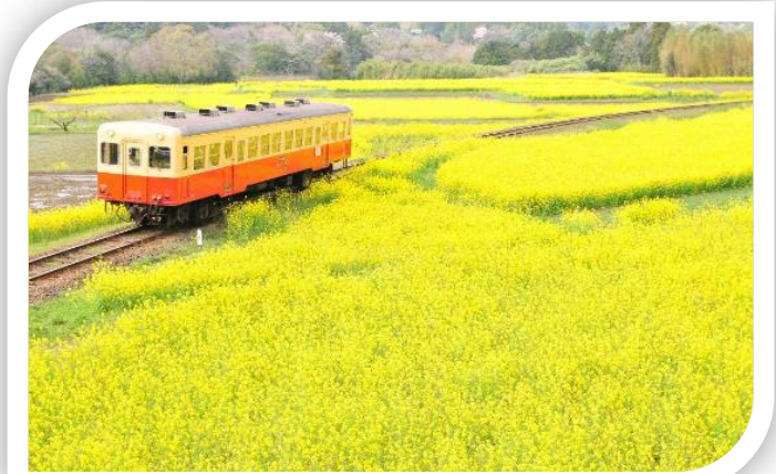
石神の菜の花畑 (上総大久保と養老溪谷の間)